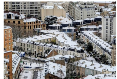
Le lotissement de la rue Dieulafoy sous la neige

Maisons rues Rousselle/ Henri-Pape/ Moulin-des-Prés. En 1909 la société coopérative HBM «la Petite- Chaumière» achète à la Ville un terrain triangulaire de 3 675m 2 . Elle revend aux sociétaires trente lots d'une surface moyenne de 125m 2 , chacun choisissant son architecte pour construire avec une emprise au sol de l'ordre de 40m 2 . Maisons hétéroclites avec en commun alignement sur rue, surélévation du RdC, étage sous les combles, jardin potager en cœur de parcelle. Et huit maisons identiques rue Henri-Pape, réalisées en 1911 par l'architecte Rebersat.