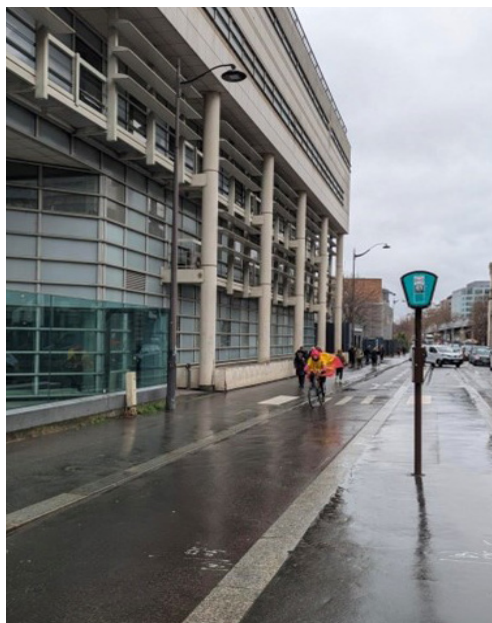
Le Boulevard Vincent Auriol... sans banc

Heureux habitants du 13 e , nous bénéficions du plus grand hôpital d'Europe, on peut attraper toutes les maladies, pas besoin de courir tout Paris. Dans l'immense espace de l'hôpital, il y a même des petits bus, c'est presque la campagne avec des fleurs joyeuses.