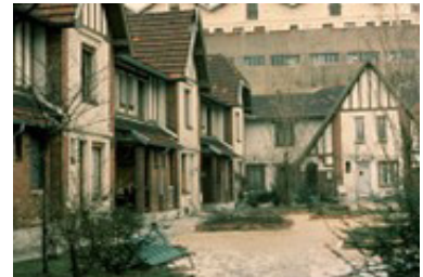
Cité Daviel ou « Petite-Alsace »

Cité Daviel ou « Petite-Alsace ». Relevant de la typologie «maisons ouvrières» et inaugurée en 1913, elle réunit 40 pavillons mitoyens autour d'une vaste cour arborée (58m x 17m), selon la composition de la cité jardin. L'architecte Jean Walter associe pans de bois, briques, parpaings et couvre de tuiles mécaniques. Le pavillon type propose cuisine, salon, 2 ou 3 chambres, cave ou atelier. Dans les années 20 ces pavillons, possédés par la société d'habitation familiale du Moulin-Vert, vont loger 40 familles avec 213 enfants. «La maison individuelle garantissait contrairement aux immeubles collectifs - les hôtels meublés - l'indépendance, la cohésion de la famille, ainsi que la moralité du foyer» (H. Deroy, Les Œuvres du Moulin-Vert, 1927).