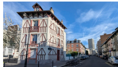
Angle de la rue du docteur Leray