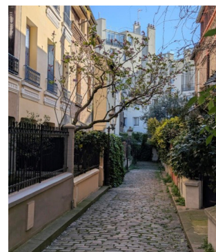
Square des Peupliers

La Cité-fleurie située au 65 bd Arago relève de la typologie des cités d'artistes, comme la Cité-verte , passage pavé d'une centaine de mètres desservant de petits ateliers au 149 rue Léon-Maurice-Nordman ou