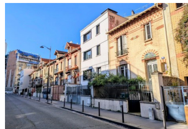
Rue de la Colonie