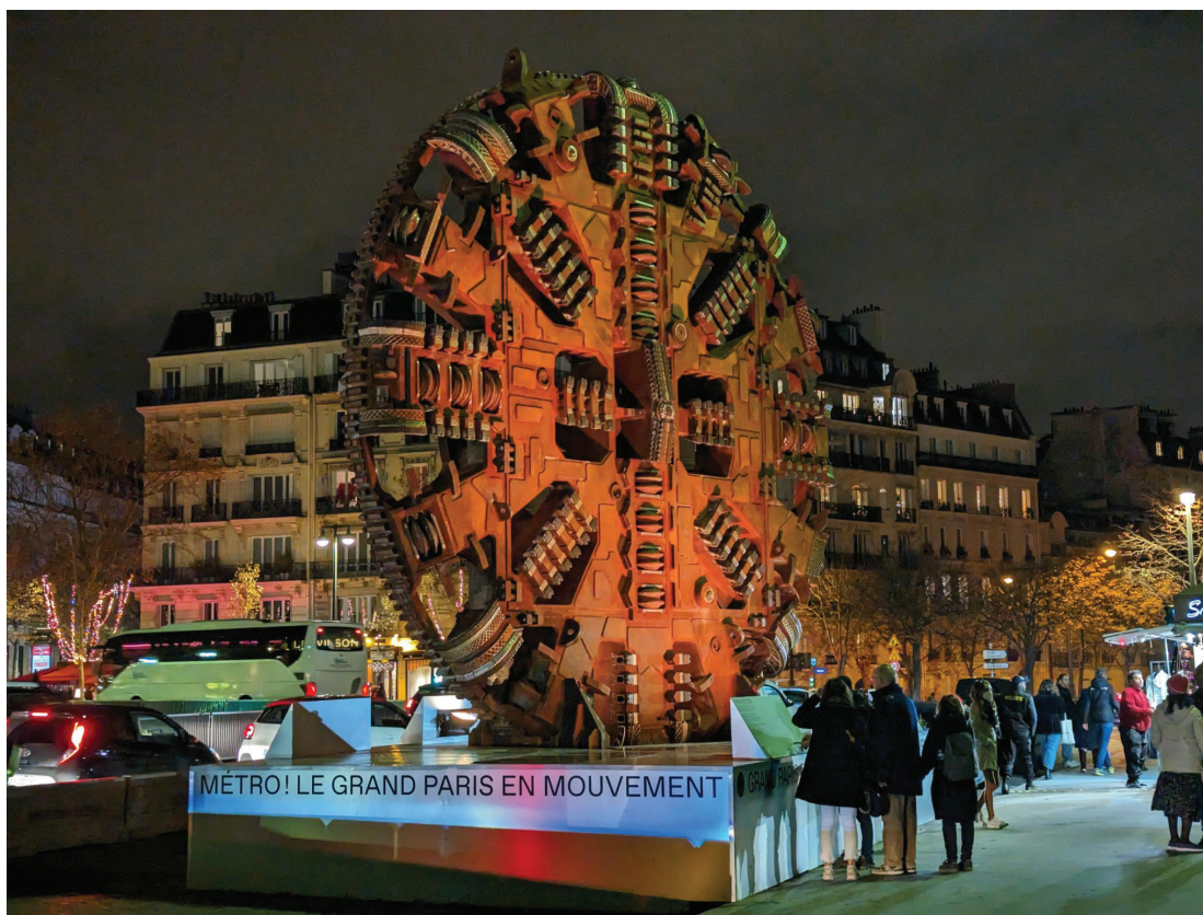
Tunnelier de forage utilisé pour percer une ligne du métro du Grand Paris, exposé devant la Cité de l'architecture

La Cité de l'Architecture et du Patrimoine organise avec la Société du Grand Paris une grande exposition dédiée à l'histoire du métro parisien et aux changements urbains liés à la réalisation des nouvelles lignes du Grand Paris Express (GPE).