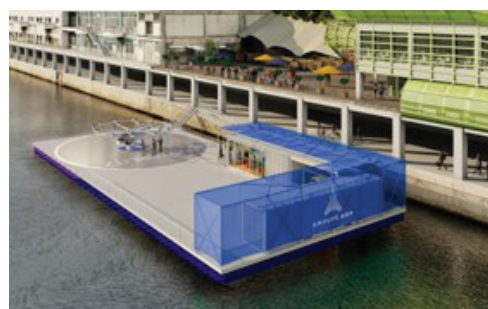
Le projet de Vertiport d'Austerlitz

Aéroports de Paris, en partenariat avec le constructeur allemand Volocopter et la région Île-de-France, veut profiter de la vitrine des jeux olympiques pour faire circuler des taxis volants électriques - mais pas silencieux - sur trois lignes