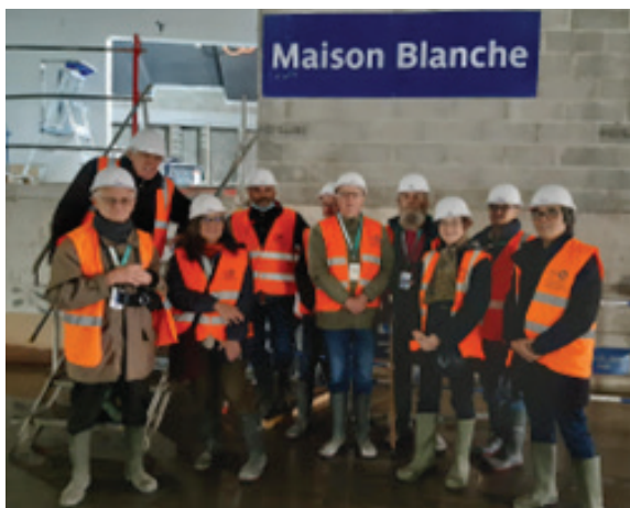
Le groupe d'ADA13 équipé pour la visite