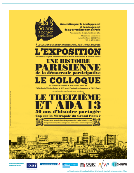
L'affiche annonçant les manifestations du 50 e anniversaire d'Ada 13.