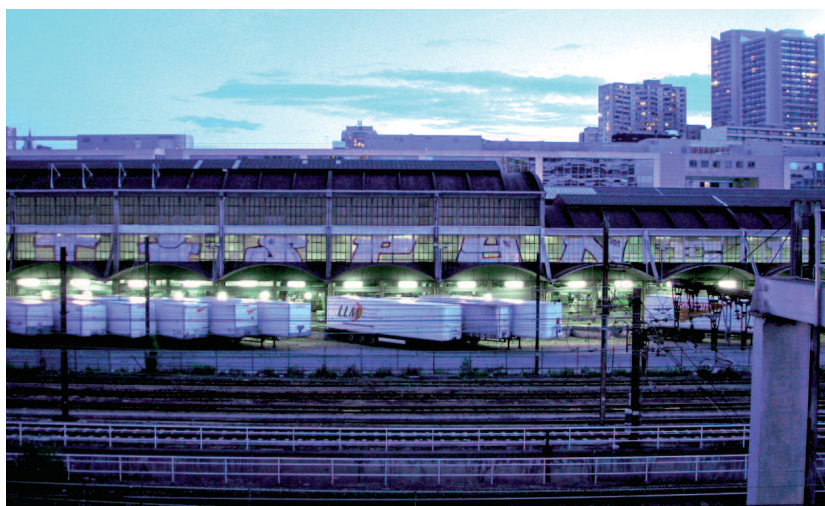
Crépuscule sur la halle Freyssinet...