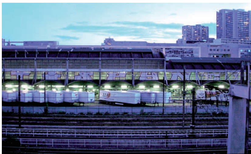
Crépuscule sur la halle Freyssinet...