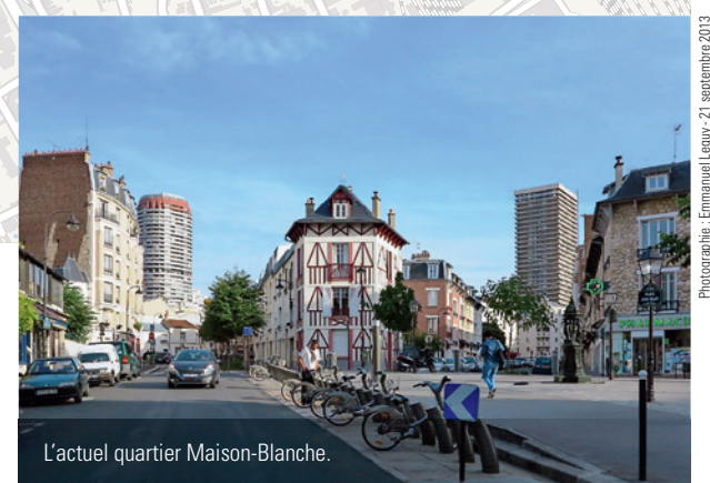
L'actuel quartier Maison-Blanche.

Les bouleversements se lisent dans un paysage qui propose une incroyable diversité de formes urbaines.